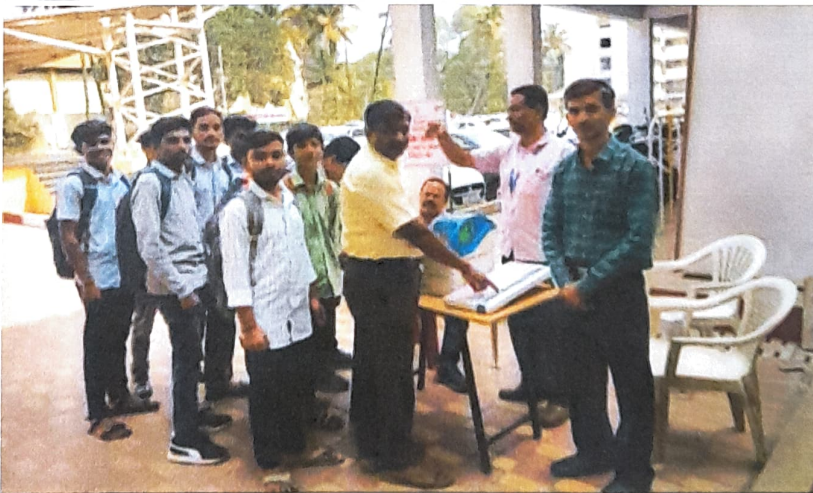
Photo 2 & 3: EVM training activity on 14/02/2024 in college campus.

10. Signatures of coordinator/ organizer: