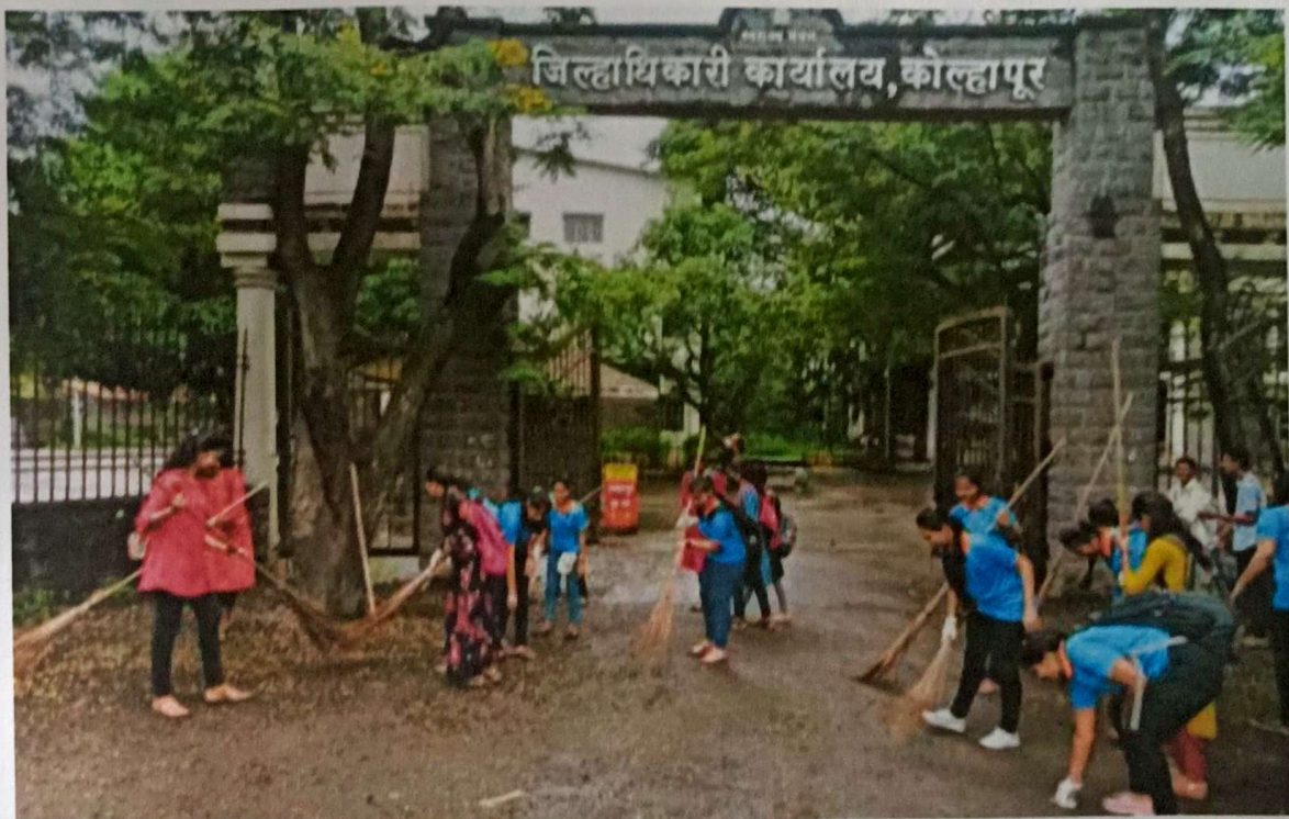
Cleanliness Activity at Collector office, Kolhapur on Mahatma Gandhi Jayanti.

10. Signatures of coordinator/ organizer: