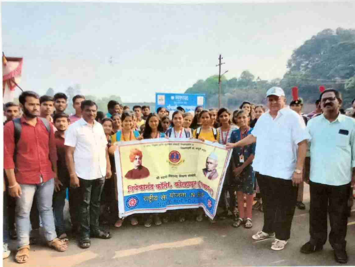
Panchganga pollution free campaign