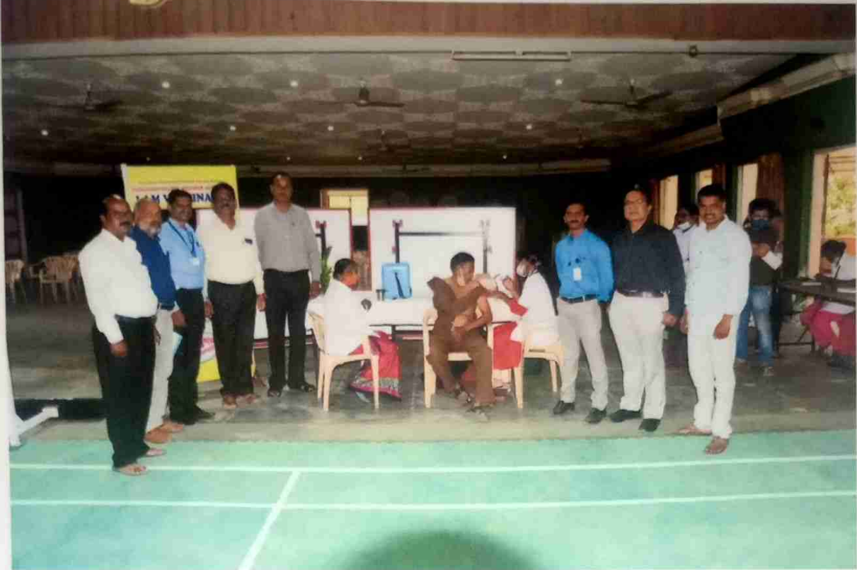
Covid-19 vaccination drive