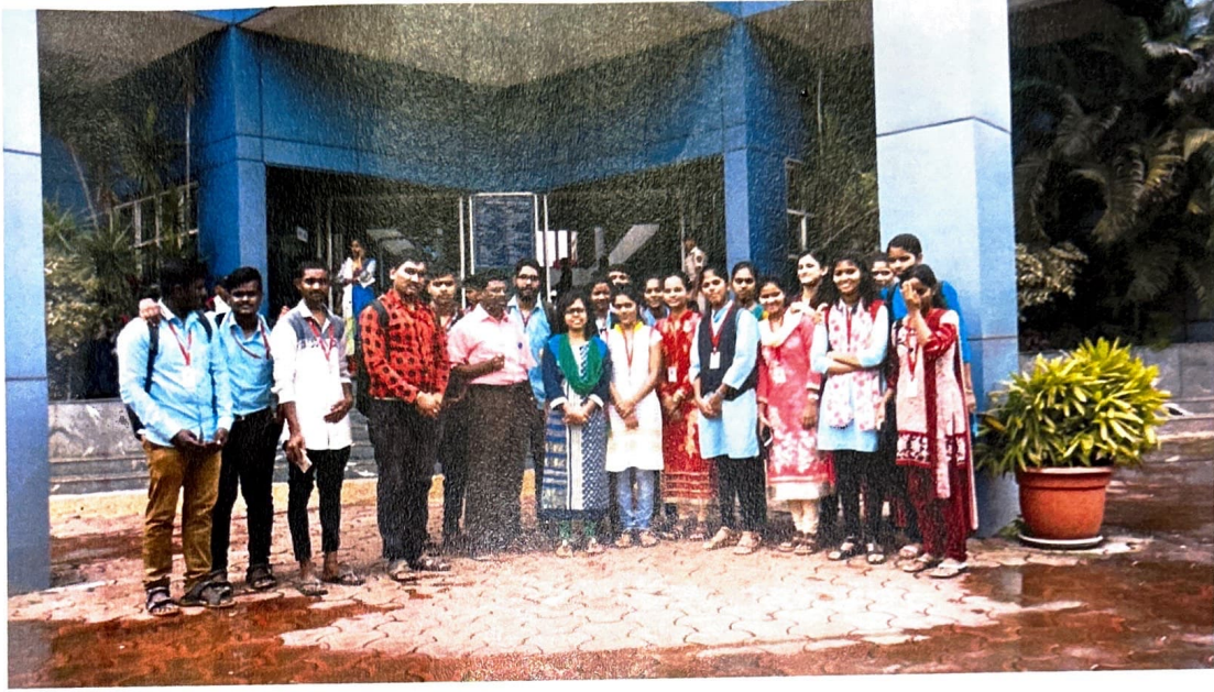
उपस्थित विद्यार्थी विद्यार्थिनी