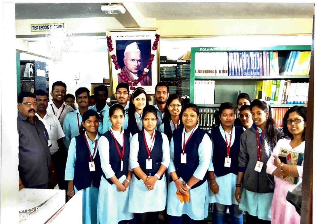
ग्रथालय भेटीत सहभागी झालेले विद्यार्थी विद्यार्थिनी