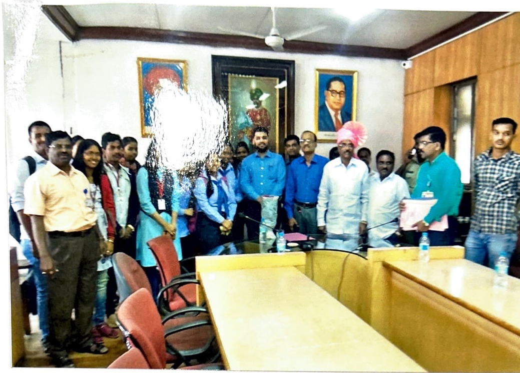
महानगरपालिकेच्या सभागृहात मा. उपायुक्त व एअर अधिकारी यांचे समवेत प्राध्यापक विद्यार्थी-विद्यार्थिनी