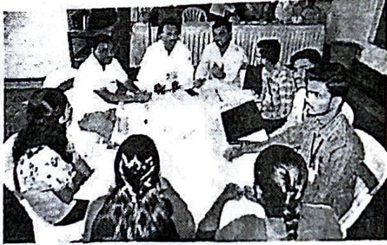
कोल्हापूर महानगरपालिकेच्यावतीने लोकशाही पंधरवडाअंतर्गत आयोजित करण्यात आली होती. त्यामध्ये महापालिकेचे पदाधिकारी, प्राध्यापक, पत्रकार, विद्यार्थ्यांनी भाग घेऊन स्पष्टपणे आपली मते मांडली.

कोल्हापूर : देशातील स्थानिक लोकसभेपर्यंतच्या निवडणुका एकाच वेळी घ्याव्यात, असा प्रस्ताव लोकशाही पंधरवडाअंतर्गत आयोजित करण्यात आला आहे. गुन्हेगारी व्यक्तींना लगेच लढविण्यास प्रतिबंधित करावा, अशा विविध सूचनाही येथे झालेल्या गटचर्चा आणि चर्चेत अनेक व्यक्तींनी केल्या. खुल्या निवडणूक आयोगाच्या अनुसार महापालिकेच्यावतीने लोकशाही पंधरवडाअंतर्गत केशवराय नाट्यगृह येथे गुन्हेगारी नागरिकांचा निवडणुकांच्या दरम्यान त्रिभुजाचा य मनायट यांचा वापर, भारतातील राष्ट्रीय सभानाचा समारंभ, मुंबईमध्ये पुरांचा व बळवा पुर यास प्रतिबंधित करण्यासाठी, सोमना आणि निवडणूक नियम, अक्षयसोमना या विषयांवर चर्चा आयोजित करण्यात आली आहे. या सभेत उपस्थित होते