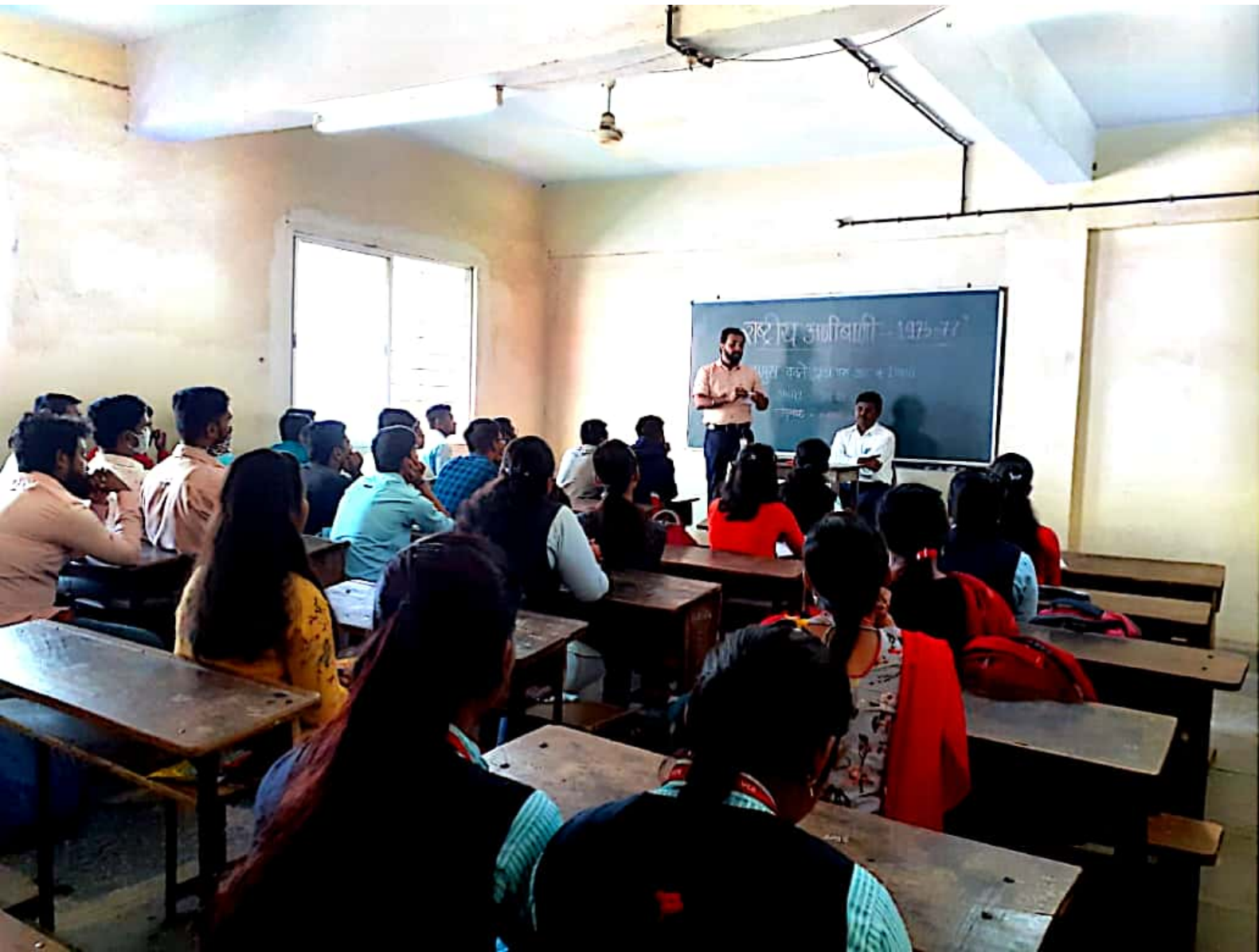
Students present for the lecture