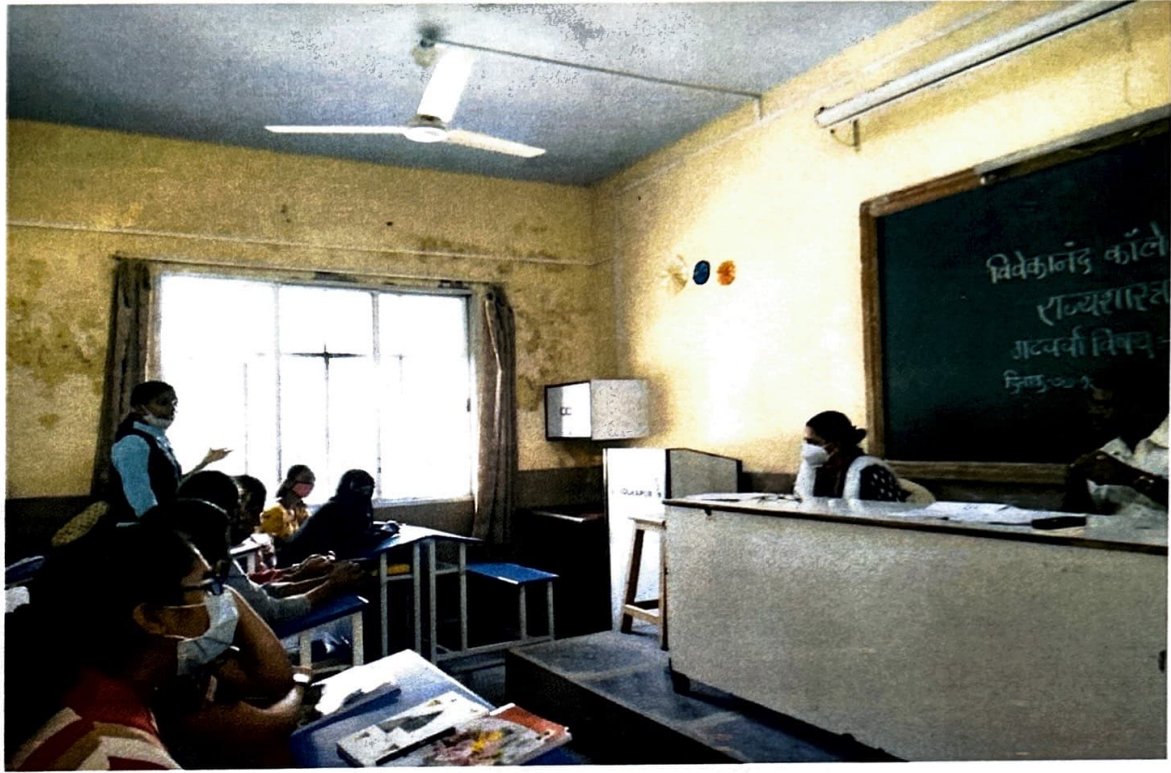
Group Discussion on Common Civil Code 07.12.2021