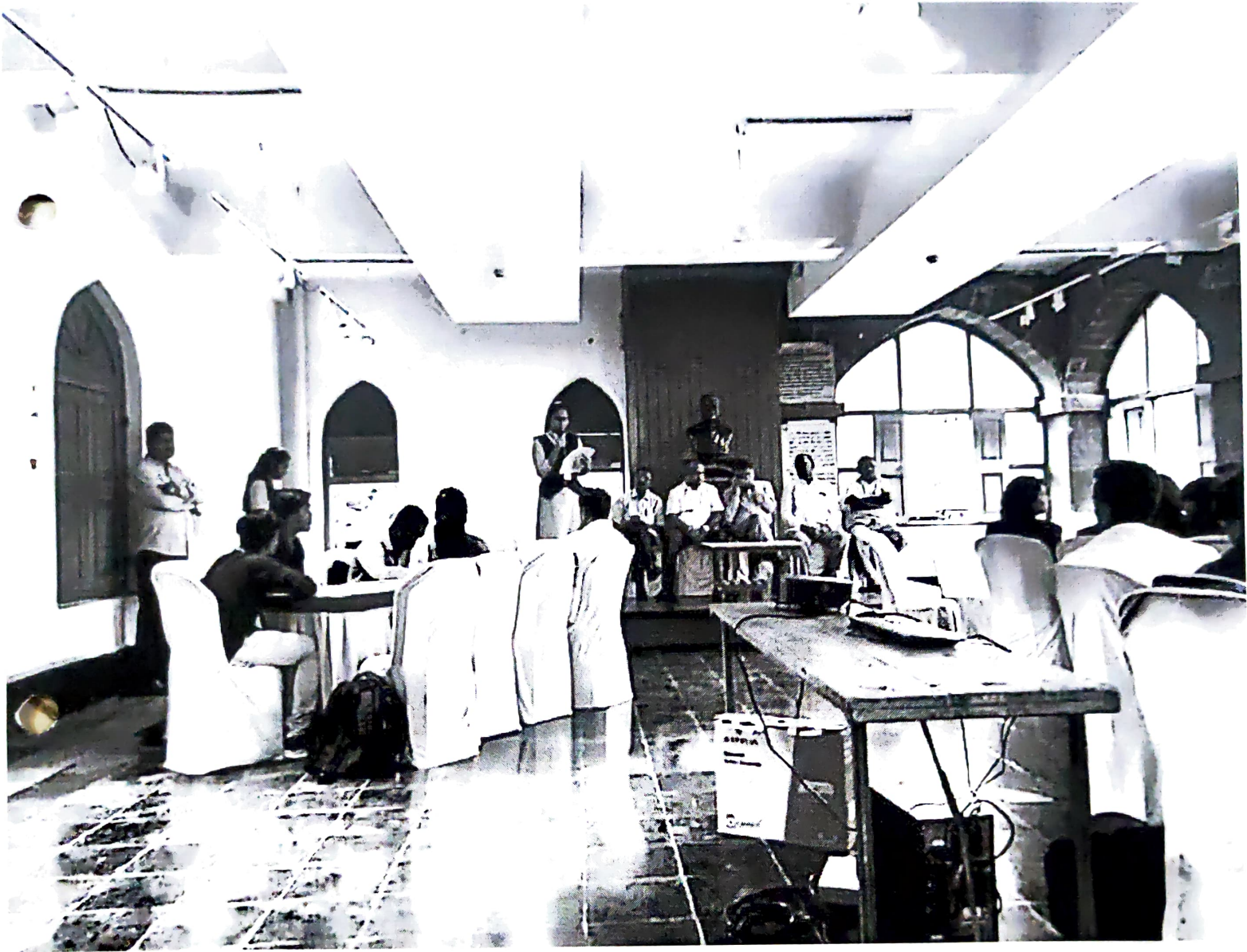
Students participated in open debate