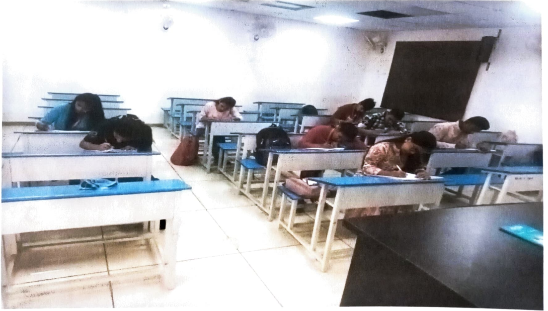
मराठी भाषा संवर्धन पंधरवडानिमित्त आयोजित शुद्धलेखन स्पर्धेसाठी विविध वर्गातील सहभागी विद्यार्थी- विद्यार्थिनी