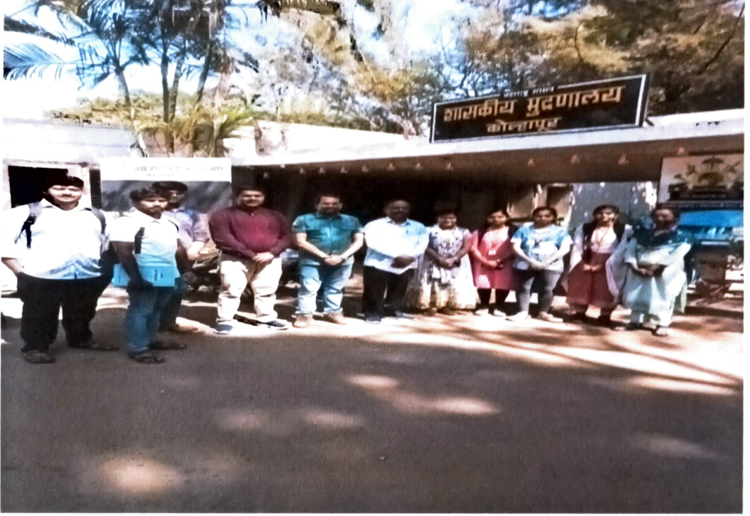
मराठी भाषा संवर्धन पंधरवडानिमित्त शासकीय मुद्रणालयास भेट