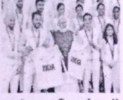
पुढील आशियाई स्पर्धेत कामगिरी अधिक उंचावेल पान क्र. ८ वर