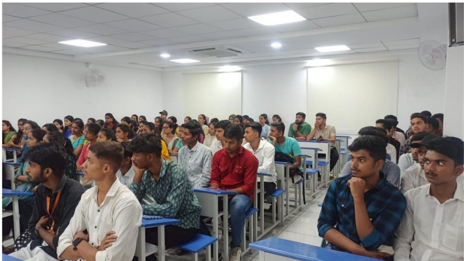
Students From B.Sc.I Entire and Optional and Students of M.Sc. I Biotechnology along with Staff of Department of Biotechnology.