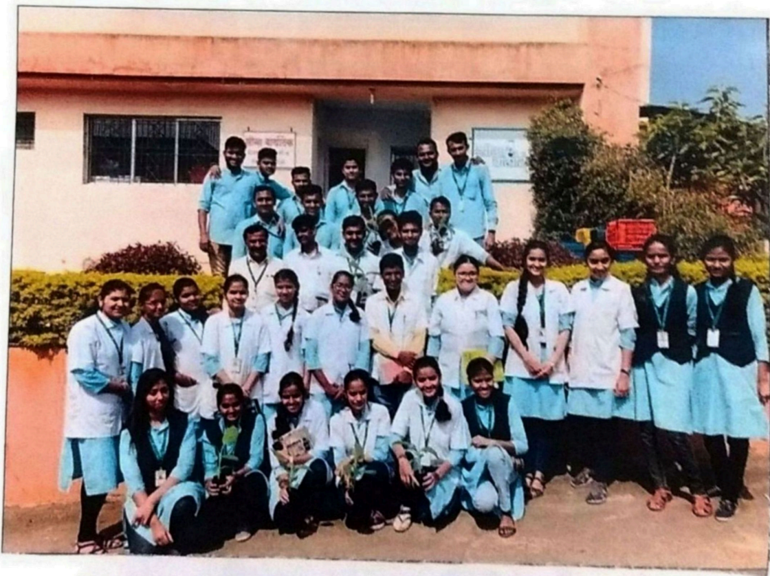
visit BSc-II, BSc-III Biotech (Ent) students