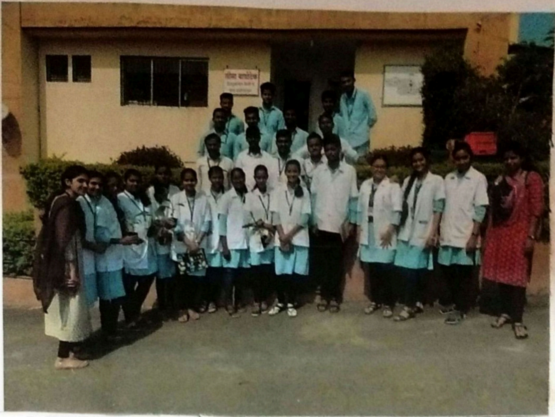
Seema Biotech. - Tissue culture Lab (08/10/2020)