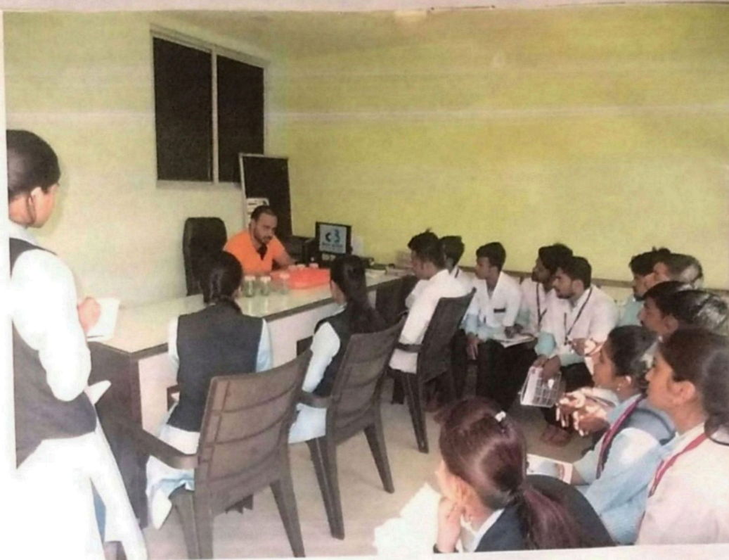
BSC. III - students Biotech. (Entire)