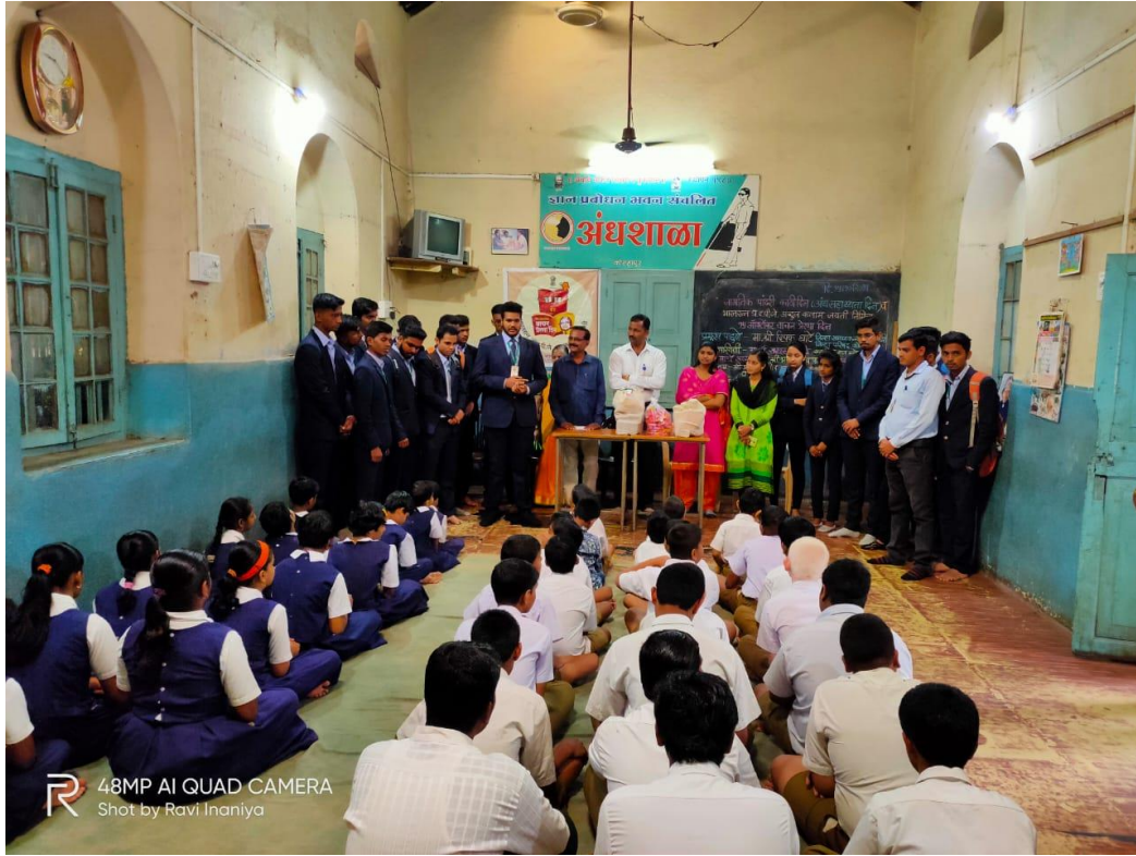
R 48MP AI QUAD CAMERA