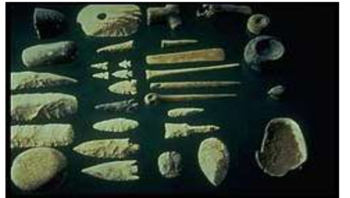
मध्याश्मयुगीन हत्यारे ("सूक्ष्मास्त्रे")